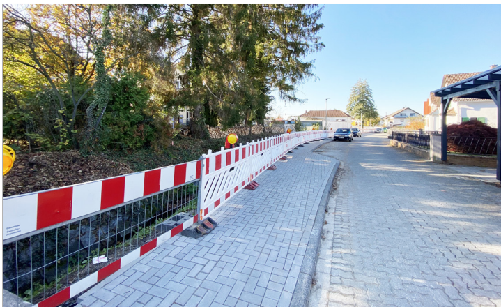
Im Bachwinkel: Sanierung der Gehweganlage entlang des Quaddelbachs, Austausch des morschen Geländers und Verbesserung der Straßenbeleuchtung.

Vier Maßnahmen werden aktuell von der Gemeindeverwaltung umgesetzt.