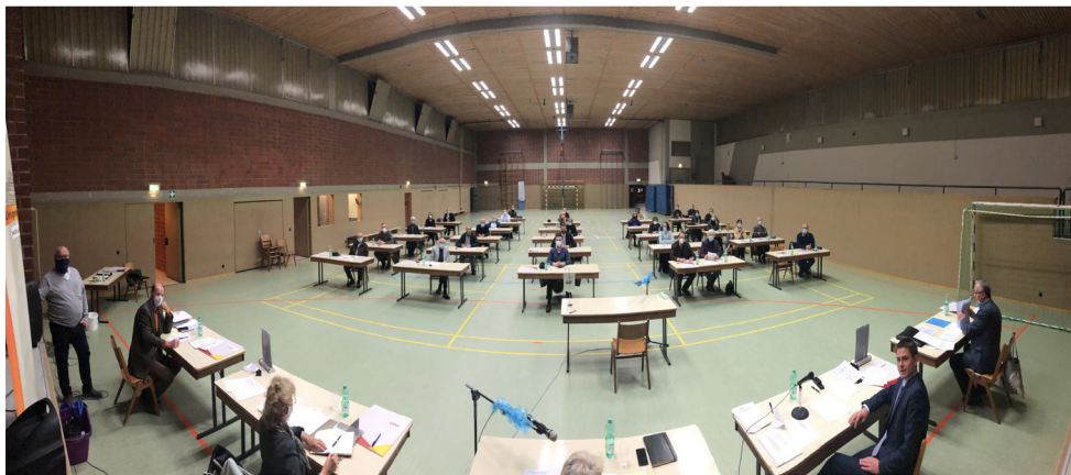
Mitgliederversammlung unter strengen Hygienemaßnahmen in der Bürgerhalle Jugenheim

„Positiv ist auch die große Bereitschaft parteiloser Kandidaten, sich für die Entwicklung der Heimatgemeinde einzusetzen“, fügte der Parteivorsitzende hinzu, denn die CDU will gute Lösungen voranbringen und ist auch offen für Engagement ohne Parteibuch.