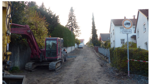
Im Hesselstal: Grundhafte Erneuerung der Straße und Pflasterung der Gehwege

Die CDU Fraktion unterstützt diese Initiative zur Daseinsvorsorge ausdrücklich, da dies im Sinne einer vernünftigen bürgerlichen Politik ist.