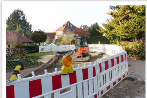
Georgenstraße / Im Rassdorf: Grundhafte Erneuerung

Im Zuge der Sanierung der Gehweganlage wird das morsche Gelände ausgetauscht und die Beleuchtung verbessert. Zum Jahresbeginn 2021 folgt die Sanierung des Brückenbauwerks. Eine Absturzsicherung wird auf die Brüstung und im Böschungsverlauf montiert.