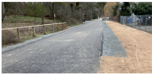
Nach Jahren der Diskussion erster Teil instandgesetzt: Viehweg zwischen Schuldorf und neuer Rettungswache