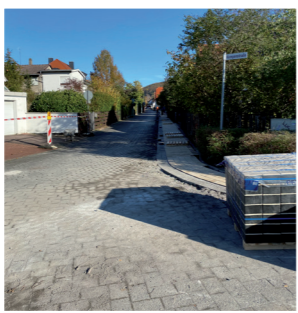
Sanierung der Weinbergstraße in Jugenheim ist abgeschlossen