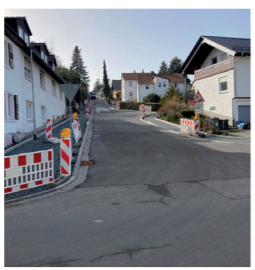
Sanierung Im Hesseltal