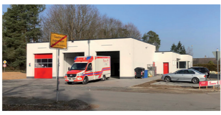
Neue Johanniter Rettungswache am Schuldorf