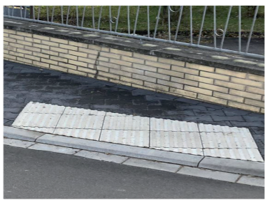
Absenkung von Bordsteinen und Einlassen von Bodenindikatoren an Übergängen.