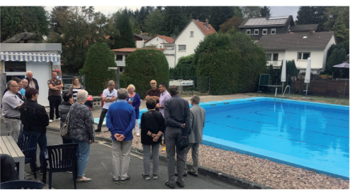
Die Sanierung des Beckens im Schwimmbad Ober-Beerbach wurde von der Gemeinde unterstützt.