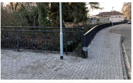
Sanierungsarbeiten im Bachwinkel sind zwischenzeitlich abgeschlossen.