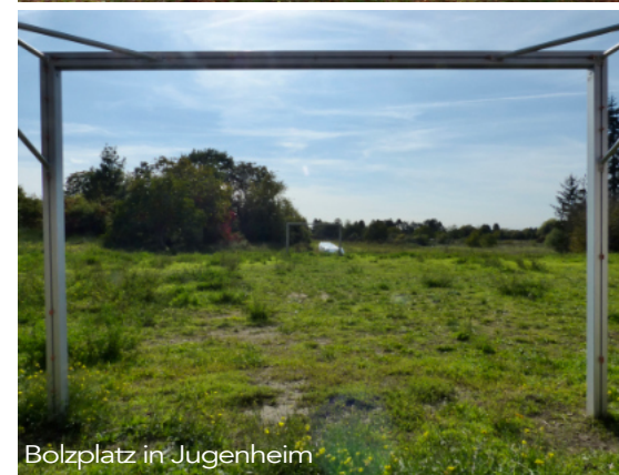
Bolzplatz in Jugenheim