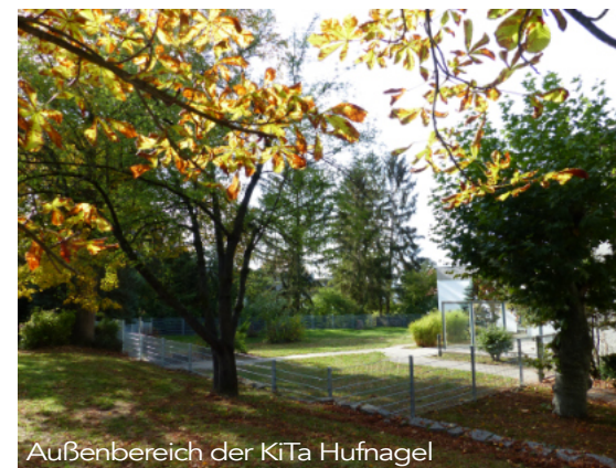
Außenbereich der KiTa Hufnagel

Im konventionellen Neubau sind die gemeindlichen Projekte nicht von den derzeit allbekannten Problemen wie Material- und Handwerker-mangel sowie Kostensteigerung verschont geblieben. Für die 3-zügige Ü3-KiTa auf dem Bolzplatz in Jugenheim wird, um eine schnellere Bezugsfähigkeit zu erreichen, neben der Planung eines konventionell gebauten Gebäudes ein Gebäude in Modulbauweise geprüft. Mit den Neubaugebieten am Zeppelinweg besteht ein weiteres Ausbaupotenzial bis zu einer 6-zügigen Kita. Auf dem Gelände „Am alten Bahnhof“ - das ehemalige HEAG-Gelände - könnte in Jugenheim mittelfristig eine 3-zügige U3-Einrichtung entstehen. AW