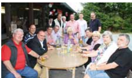
Hessischer Abend beim Neu-Anspacher CDU-Stadtverband

Die Hessenfahne flatterte im Wind, und die Dekoration war komplett in den Hessenfarben Rot und Weiß gehalten. Zurück zu den hessischen Wurzeln gingen die Neu-Anspacher Christdemokraten in diesem Jahr.