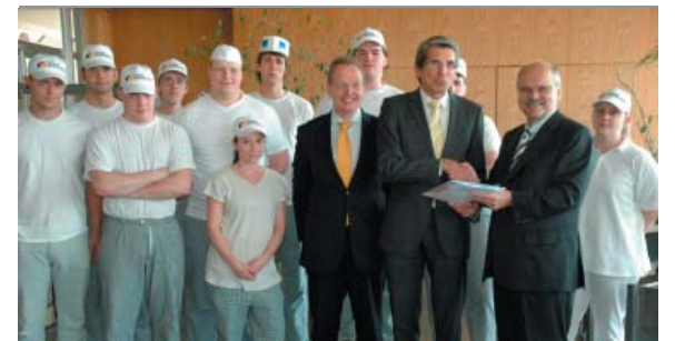
Das Weiterstädter Berufsbildungszentrum freut sich über eine Zuwendung des Bildungsministeriums

Der Erfolg: Trotz Wirtschaftskrise sieht es in diesem Jahr so aus, dass auf dem südhessischen Ausbildungsmarkt eine ausgeglichene Bilanz erreicht werden kann. Storm appelliert an die Betriebe: „Wer jetzt nicht ausbildet, dem